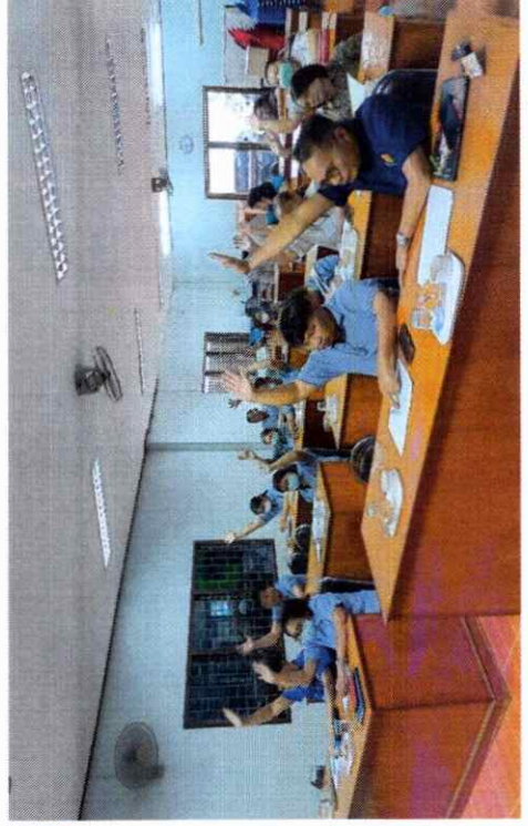
ฝ่ายนโยบายและแผนงาน องค์การบริหารส่วนตำบลบ้านยาง